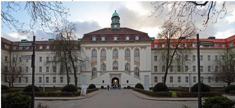
Rudolf Virchow Klinikum, Berlin

Ein anstrengender Beruf und die Versorgung von drei Kindern haben an ihrer Gesundheit gezehrt. Mitte der 1990 Jahre entwickelte sich eine Krankheit, die im Laufe der Jahre dramatischer wurde und sie zwang, Ende der 1990er Jahre aus dem Arztberuf auszusteigen.