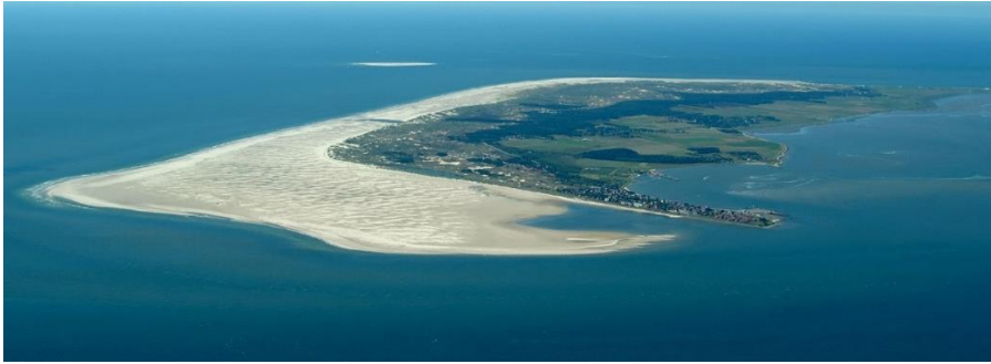
Dünenlandschaft auf Amrum