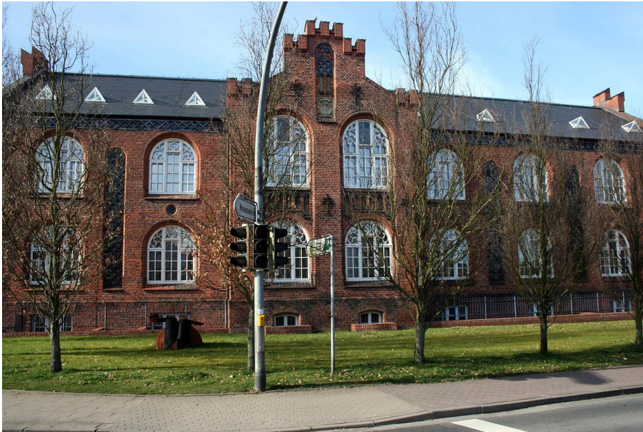
Meldorfer Gelehrtenschule/Dithmarscher Landesmuseum