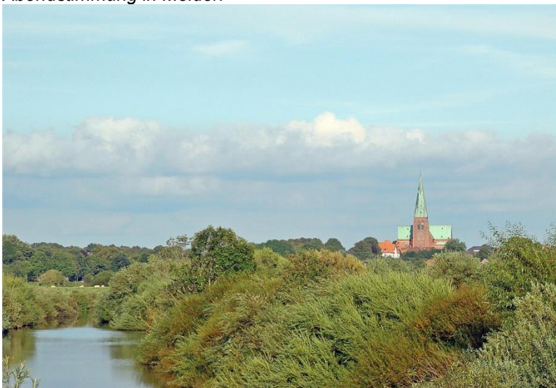
Abendstimmung in Meldorf

Aufgewachsen ist Renate in Meldorf, einer Kreisstadt in Dithmarschen an der Nordsee.